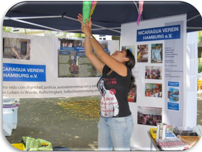
Info- Stand auf dem Methfesselfest